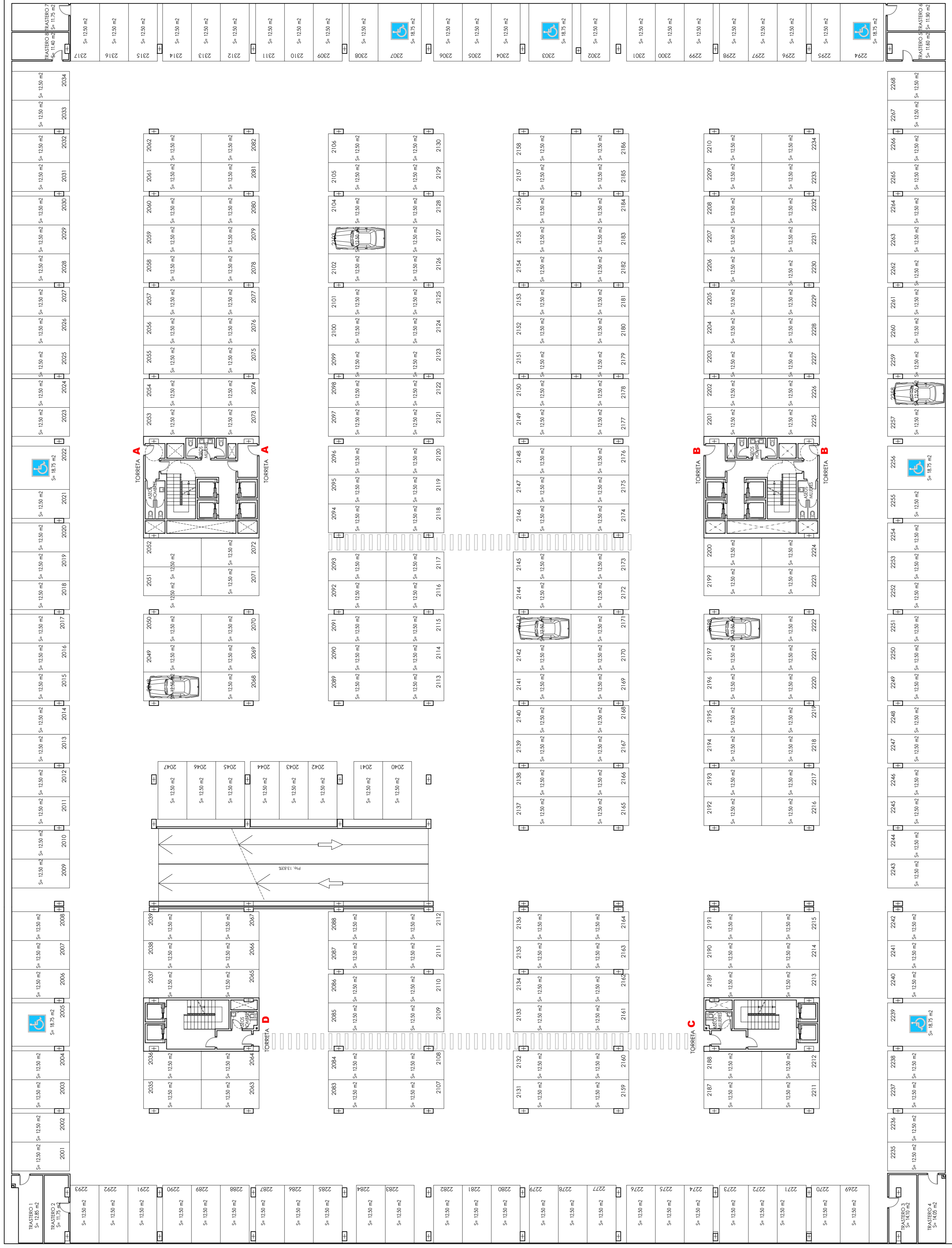
PLANTA SOTANO -2