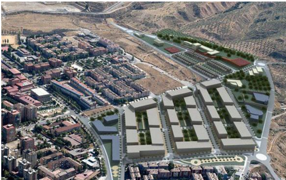
PROPUESTA DE ORDENACIÓN DEL PLAN PARCIAL