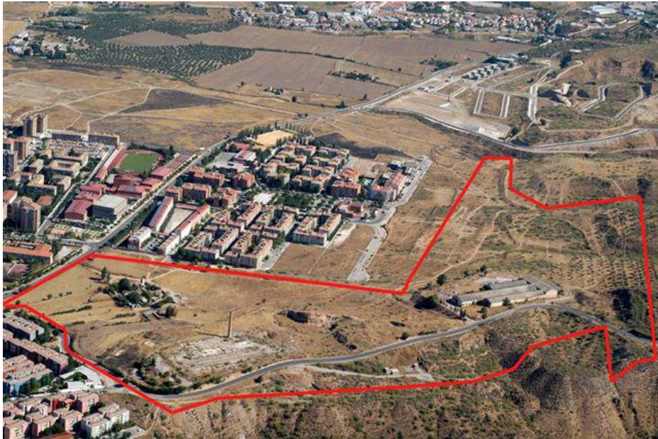
DELIMITACIÓN DEL PLAN PARCIAL

Destino: promoción de Viviendas Protegidas.