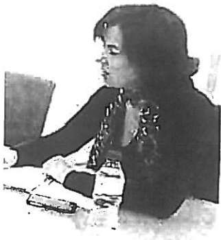
Llega, mientras el Ayuntamiento defiende una propuesta que la ministra Ana Pastor dijo que le gustaba mucho, pero sobre la que no ha emitido un dictamen.

Los coordinadores de los dos partidos irán perfilando los avances para un próximo encuentro, sin fecha.