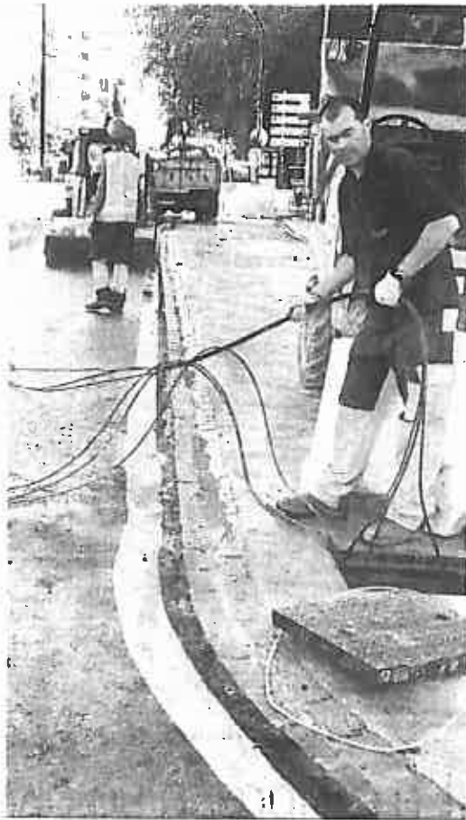
Numerosas personas se quejan por los problemas de la obra del Metro.

Asimismo, recordó que para contactar con el Defensor del Ciudadano se puede acceder a través de la página web, por teléfono o en el Ayuntamiento.