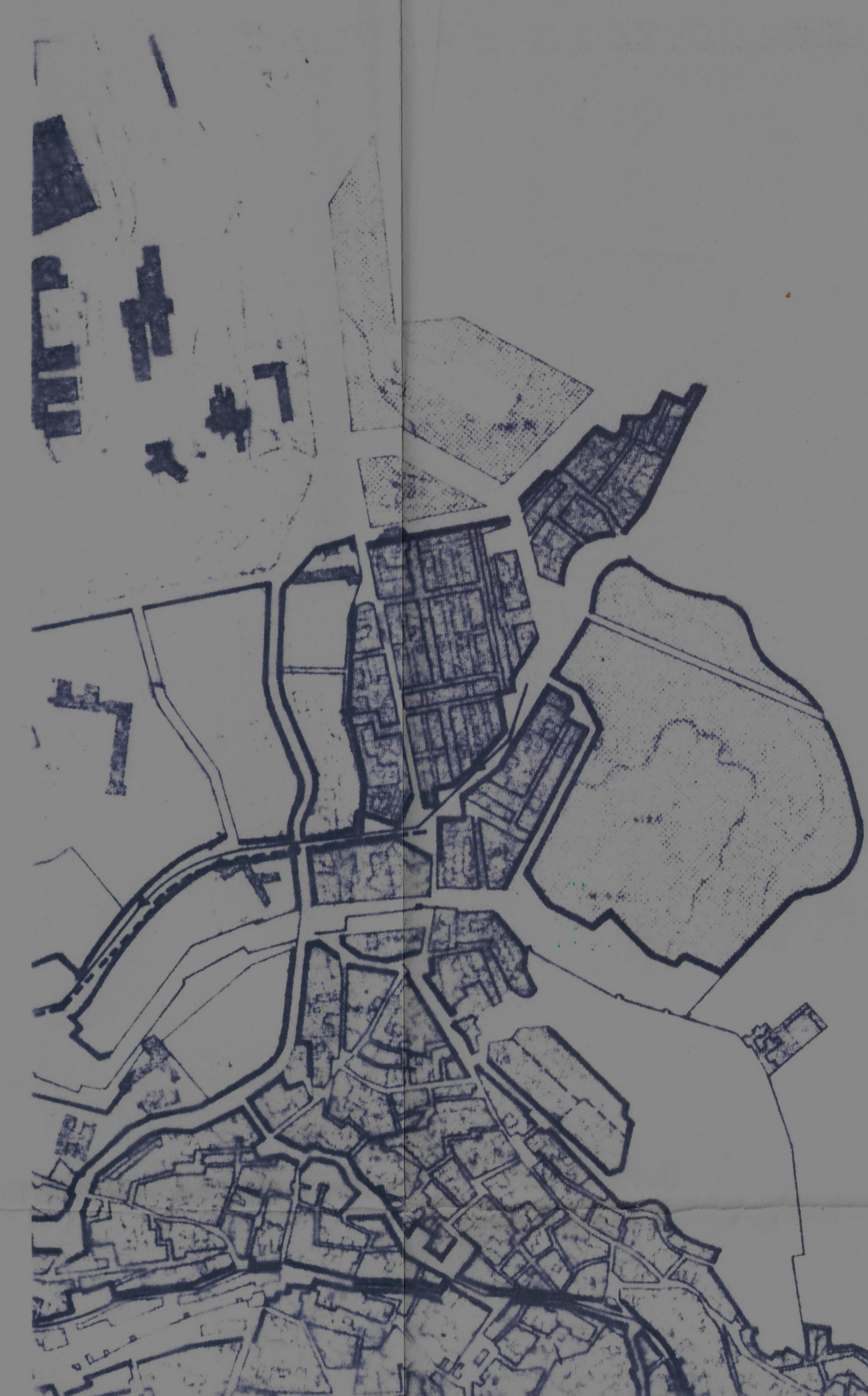
RED DE SANEAMIENTO