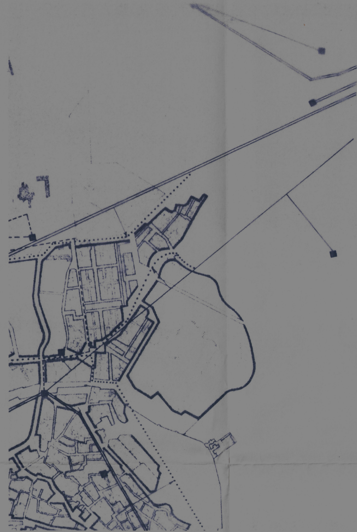
RED DE SUMINISTRO DE ENERGIA ELECTRICA