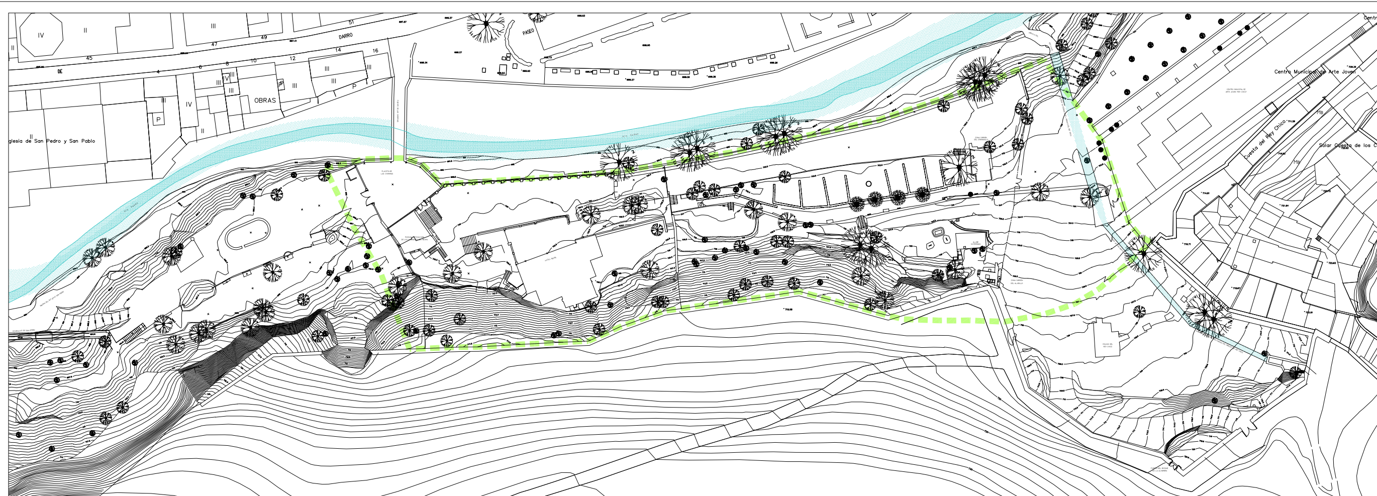
Ámbito del Estudio de Detalle