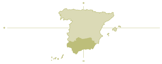
[ Predicciones* ]