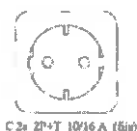
C 2a 2P+T 10/16 A (fija)